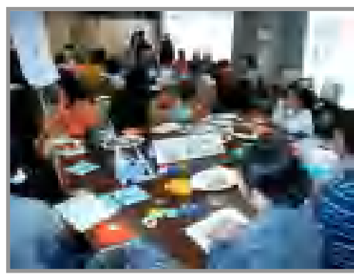
アイランド式交歓会：折り紙の島