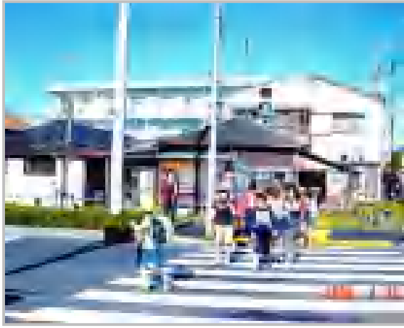
通学児童の安全確保/玉川小学区域