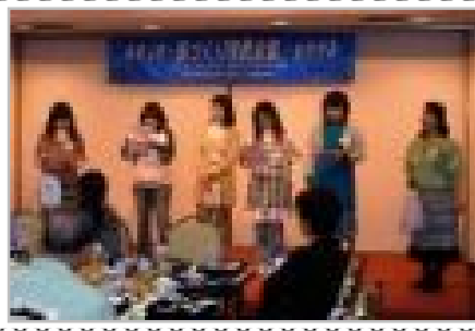
クイズ (読み聞かせ部会)