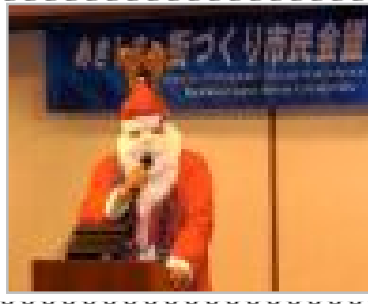
フィンランドからの友人 (街並み部会)