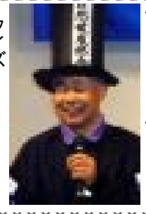
マジック (自然健康部会)