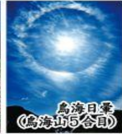
鳥海日暈 (鳥海山5合目)