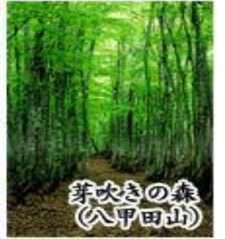
芽吹きの新緑 (八甲田山)