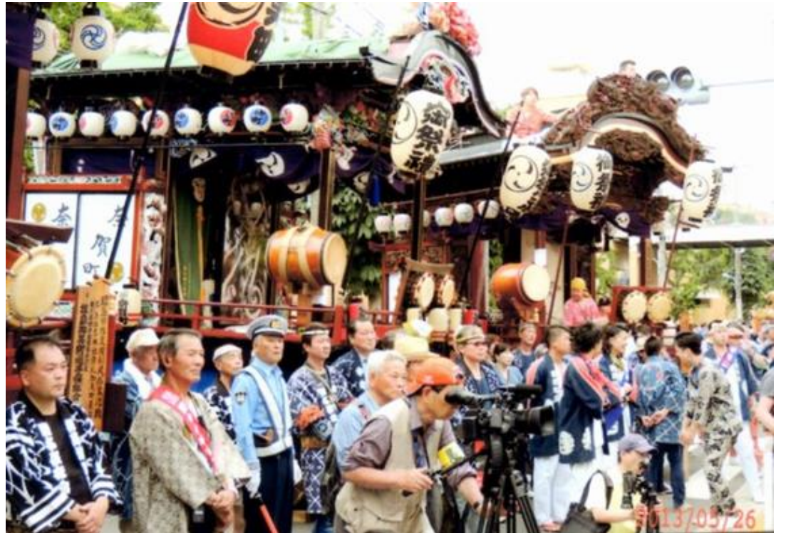
集合した昭島市指定有形民俗文化財の屋台と山車群