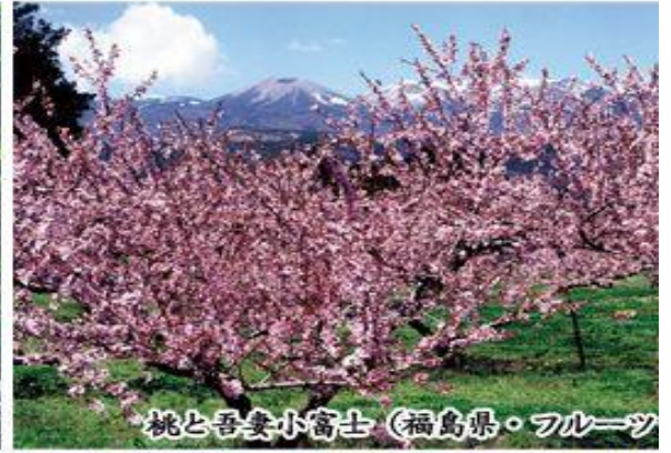
桃と吾妻小富士 (福島県・フルーツ)