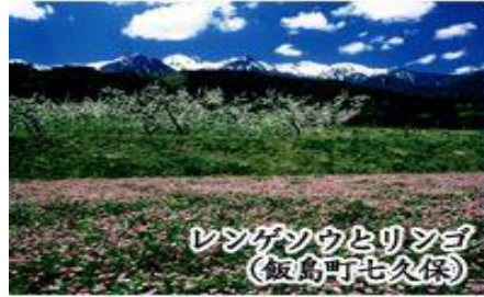
レンゲソウとリンゴ (飯島町七久保)